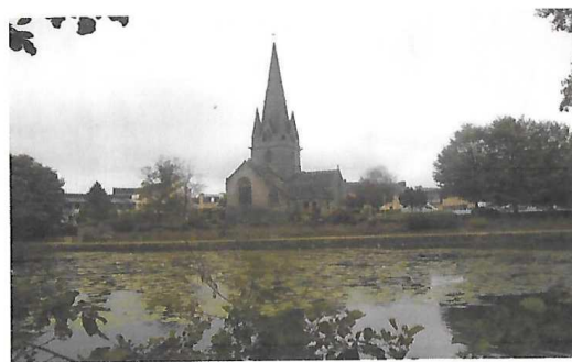
Eglise de Rosporden

Vous poursuivez votre randonnée en pédalant sur une route bordée de talus passant devant des exploitations agricoles puis vous arrivez sur une départementale que vous quittez aussitôt pour retrouver une petite route calme vous ramenant à la cité des Etangs