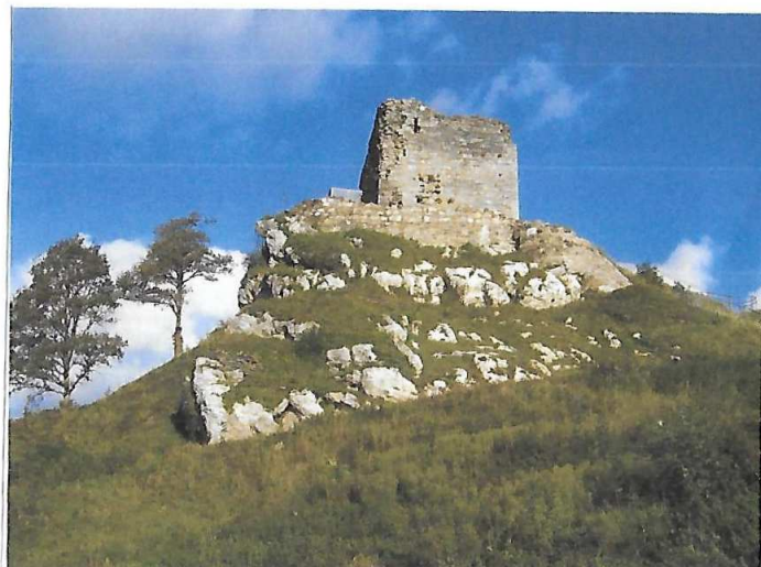
Le château de La Roche Maurice