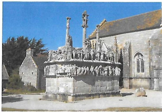
Le calvaire de Tronoan

Ploneour-Lanvern sera le point culminant (modeste : 70 m) de votre parcours et, après un passage par l'imposante chapelle de Languivoa (dont le clocher n'a plus de flèche depuis la révolte des "bonnets rouges" en 1679), ce sera le retour sur Pont l'Abbé.