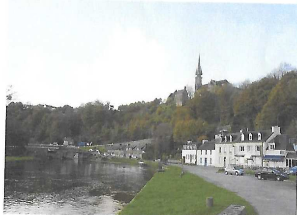
Le Canal à Châteauneuf du Faou

Après une dernière traversée de l'Aulne, vous reprendrez la route vers votre point de départ.