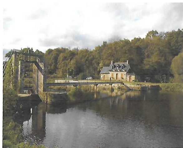
L'écluse de St Hernin

Au lieu-dit "Croaz Hent", point culminant de la randonnée, vous prendrez la direction de Carhaix où une ultime bosse vous attend avant de rejoindre votre point de départ.